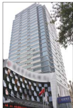
▲淄博华都置业发展有限公司开发的华都名城。

购房者对房屋及其产权进行检验,认为符合合同约定条件的,应与开发商签订房屋交接书。