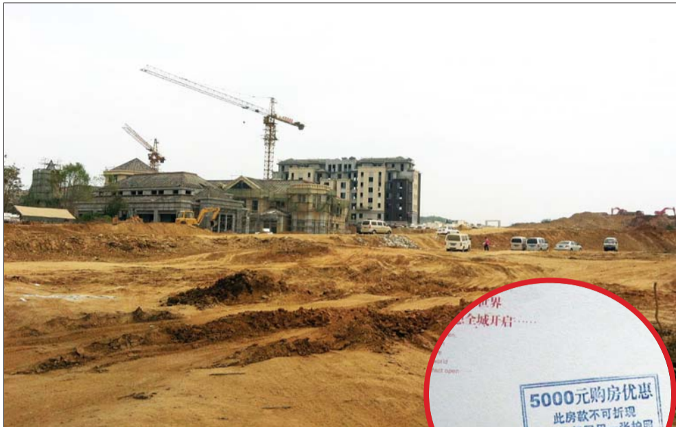
▲位于莱山区裕格庄立交桥附近的金地格林世界楼盘。