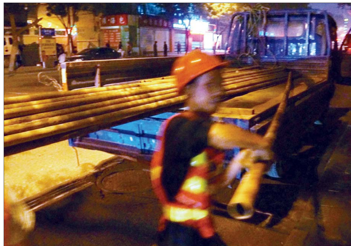
和平路与山大路交会口西侧路南的人行道上施工人员正在卸铁管子。

山东省政协委员宋传杰曾表示, BRT网络完善后,将发挥枢纽型交通的作用,承担主干道客流,普通公交将成为支流补充。未来, BRT网络将覆盖济南主要交通干线,远期BRT与轨道交通相结合。同时,济南将加强多种交通方式相互衔接,加快公交换乘枢纽和停车系统建设。