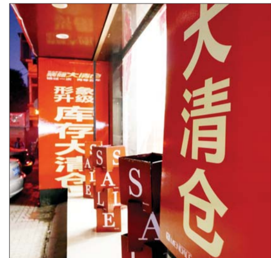
和平路一商家打出清仓的招牌。

虽说拓宽道路估计到不了这边,但肯定会影响到生意。公交线路调整后不经过这里,到时候过来的人也就少了。“施工会持续小半年,肯定会影响生意的。”一家服装店的老板说。 对于两侧的餐饮商家来讲,今年的人气本来就不好,道路改造肯定要对其营业额产生影响,至于会有多大影响,大多都表示尚未可知。 “租房价格还没降低,改造好了还有可能会涨呢。”据悉,和平路全面施工后,沿线交通会有很大不便,但房屋出租价格目前并未下降。一名中介表示,道路改造对房屋出租价格影响不大,道路改造后交通便利,或许还会拉动周边房租的提升。