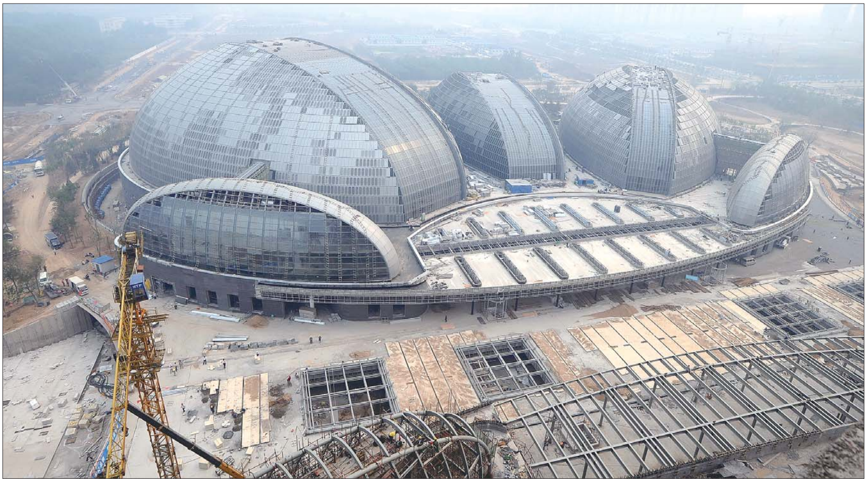
正在紧张施工的济南大剧院。