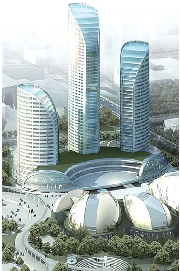
▼济南大剧院鸟瞰效果图。