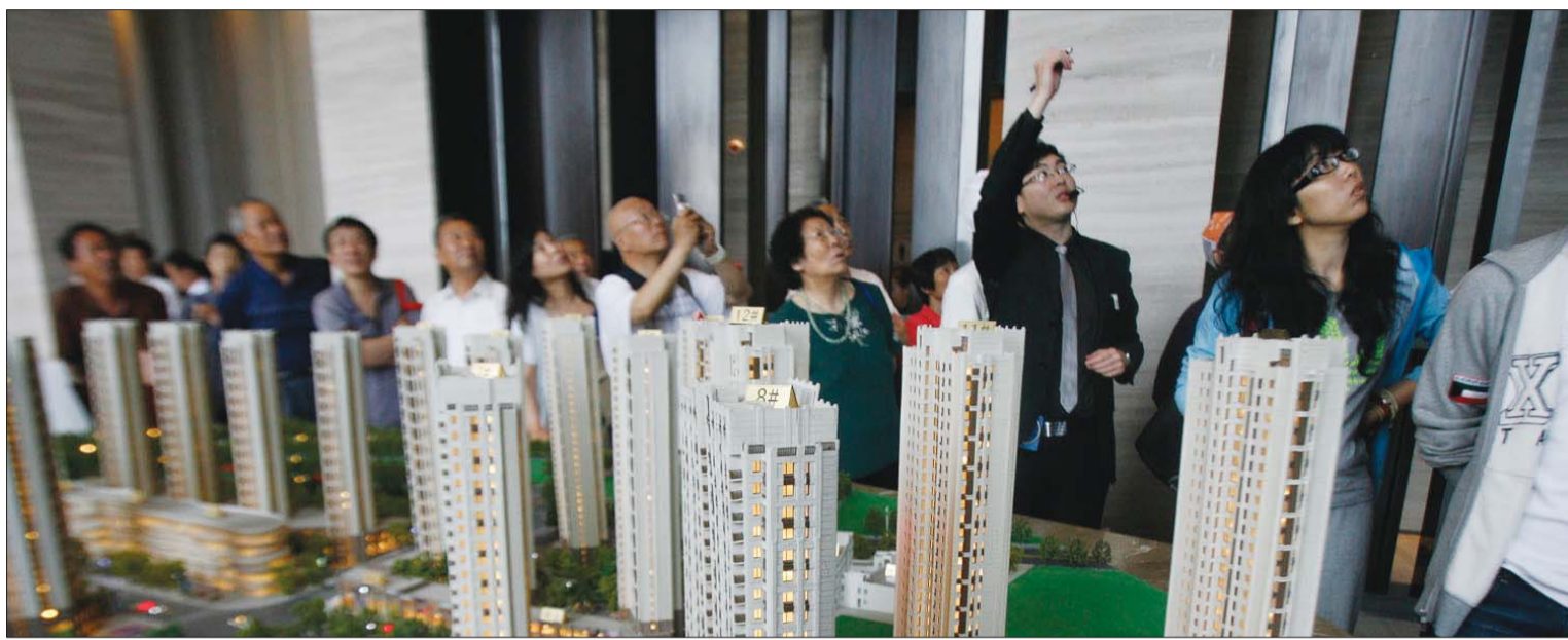
25日,在金茂湾小区,看房团在了解楼盘信息。