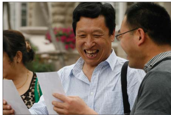
在湛园海德公园一号,销售中心赠送看房团每人一张在小区的照片,让看房团成员很开心。

根据看房团成员的需要,本报对青岛的房地产项目精挑细选,最终选定了西海岸的两座生态大盘:万科小镇和湛园·海德公园一号,市南区的金茂湾和鲁商·首府共4个项目供看房团参观。