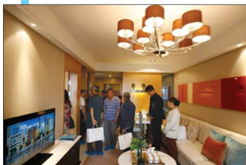
看房团在参观金茂湾小区样板间。