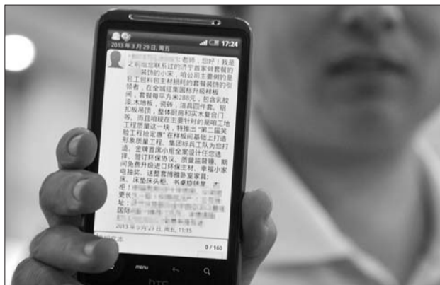
业主收到的装饰公司的推销信息。

王可建还提到,按照刑法第二百五十三条第一款的规定,如果是国家机关或者金融、电信、教育、医疗等单位工作人员违反国家规定,将本单位在履行职责或者提供服务过程中获取的公民个人信息,出售或者非法提供给他人,情节严重的,处三年以下有期徒刑或者拘役,并处或者单处罚金。