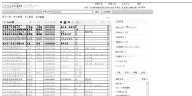
82名老板的详细个人信息出现在“道客巴巴”网上。网站截图。

记者也试图通过站内信息联系上传该文档的网友“wx31cd78”,了解这份文档的出处,不过截至记者发稿时,并没有收到任何回应。