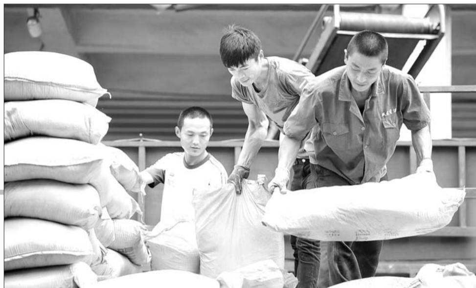
▶25日,在济南盖家沟物流中心,几名工人正在装卸货物。山东即将启动“营改增”试点,物流业将受较大影响。

“营改增”后,试点行业内的税负将增加还是减轻?企业将如何应对?我省是否还将有配套措施出台?