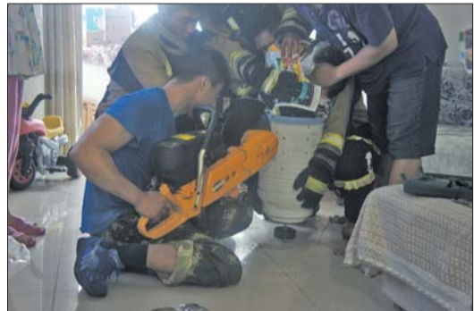
救援人员正在破拆洗衣机滚筒。

小男孩的家人称,孩子在家里玩,谁也没想到会发生这样的事。今后一定看好孩子,这回可把孩子和家人吓坏了。