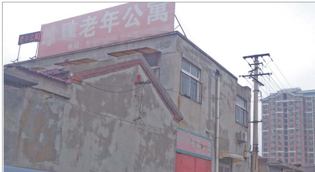
从外面看,老年公寓较为破旧。

本报济南5月27日讯(记者 王兴飞 实习生 闫赞) 27日早上,济南市槐荫区闫千户小区一老年公寓内,一名82岁老太被发现死于自己房间内。公寓管理方称老人是自杀,而死者亲属怀疑老人死亡过于蹊跷。目前,警方正对此事展开调查。