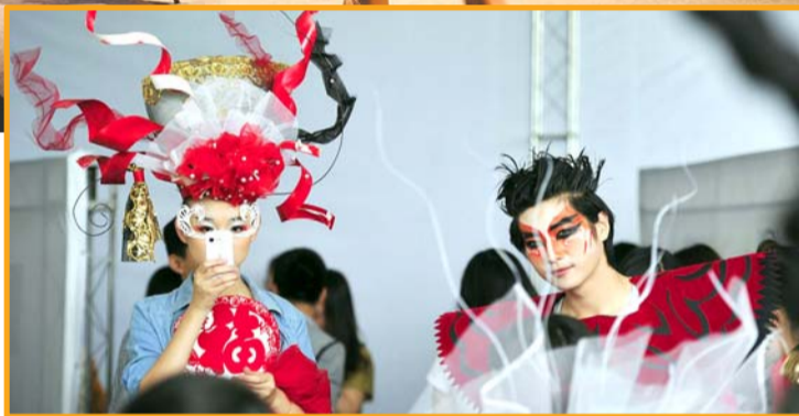
▲装扮好的模特们在后台玩自拍。相比T型台镁光灯下的光鲜亮丽,这些年轻人上台前的紧张、俏皮、可爱在后台显得淋漓尽致。