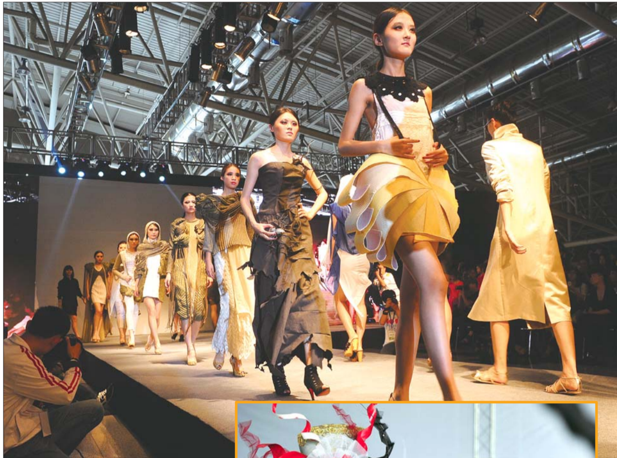
▲28日,在济南舜耕国际会展中心,来自山东工艺美术学院的大学生模特们展示自己和同学设计的毕业服装作品,而艺术设计类毕业生则展示出自己丰富多彩的设计作品。

曾与山工艺合作过的蓝海集团总监李伟告诉记者,该企业这两年都会接收山工艺的实习生,通过实训,学生亲身体会了设计的整个过程。毕业后如果有意向并且作品优秀,还有机会到该企业工作。