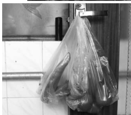
人们对使用超薄塑料袋习以为常。