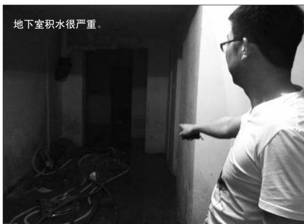
地下室积水很严重。

本报5月28日讯(记者 秦昕 宋昊阳)潍城区西域名都二号楼一单元的二十户业主最近遇上了一件烦心事，小区地下室从两个月前就开始渗水。28日，记者来到西域名都，发现原本好好的地下室几乎变成了水窖，被泡过的物品堆了一地。