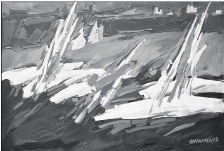
△青岛印象 晨晓作品

在新西兰,晨晓是唯一一个以华裔艺术家身份进入西方主流画廊的画家,并自1998年起在新西兰、澳大利亚、美国和英国连续举办个人画展,是新西兰名列前茅、作品被收藏率最高的艺术家之一。他的作品被世界众多知名美术馆、博物馆、新西兰国会大厦、总督府等公共机构和著名商业机构以及西方收藏家广泛收藏。作为新西兰当代唯美表现主义的代表人物,晨晓在新西兰当代艺术史中占有重要地位,其作品被收录进新西兰教科书中,同时出版过多个人画册和诗集。(毛公强)