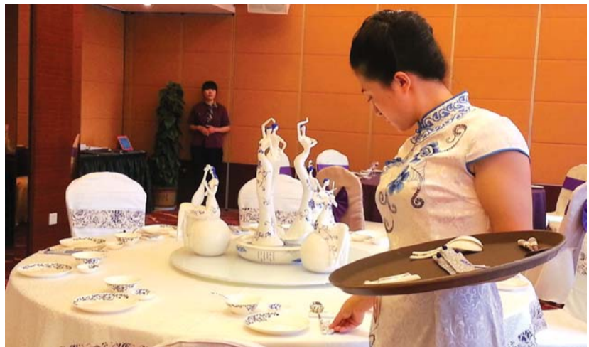
随着泰安旅游业发展，旅游人才培养是涉旅行业当务之急。

其实，不少星级旅游饭店为了招揽人才专门提高了待遇和福利，但依然招不到人。“本科生来我们酒店工作，工资要比高中生高出不少，还提供住宿和其他福利，而且还有完整的晋升机制。只要干得好，两年就能