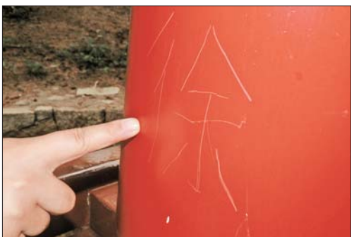
▲环翠楼公园的一处柱子上,一个“徐”字在朱红漆的衬托下格外醒目。