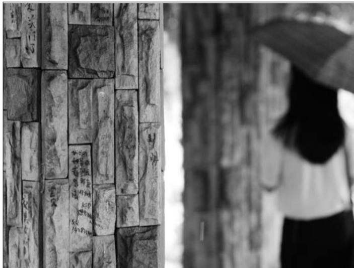
▲市人民公园湖心岛长廊的石柱上被涂鸦覆盖。

潭溪山风景区副总经理陈延忠也认为,景区应该对游客进行疏导。“游客在景区涂鸦有时候是一种需求,景区可以通过其他途径来满足游客的需求。”