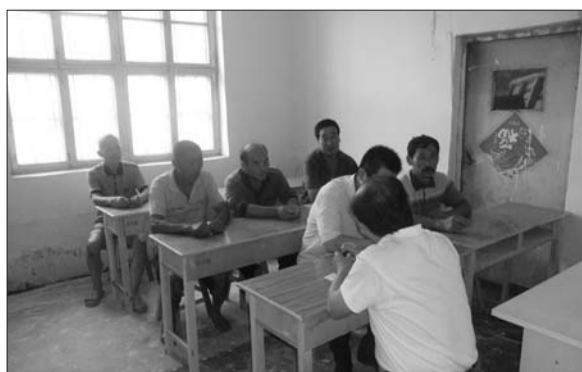
庆云镇村支书讲解计生优惠政策。