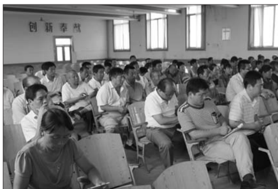
庆云镇召开夏季计生工作会议。