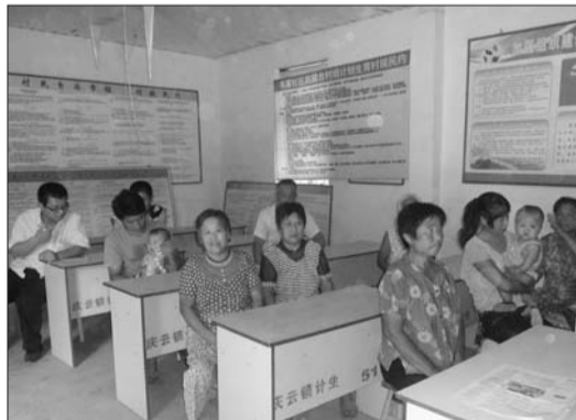
庆云镇群众代表在计生活动室学习计生保健知识。