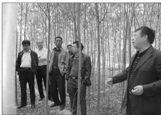
林业局技术人员现场对庆云镇计生困难户进行技术指导。