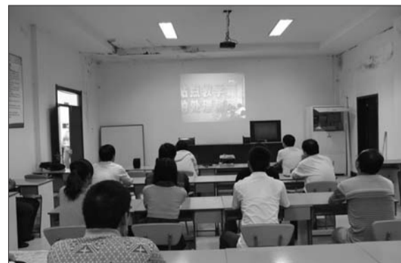
庆云镇计生干部进行集中学习。