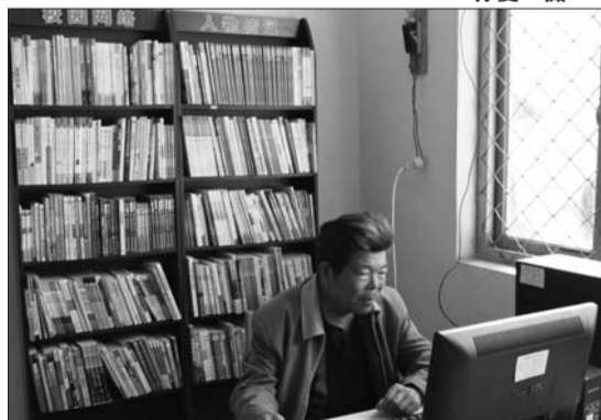
庆云镇群众在计生活动室上网查阅资料。