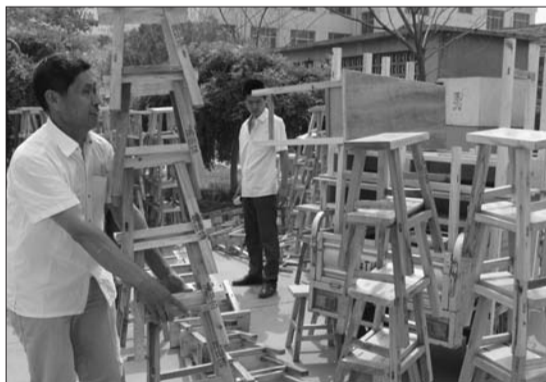
庆云镇计生服务站为村级计生室添置办公桌椅。