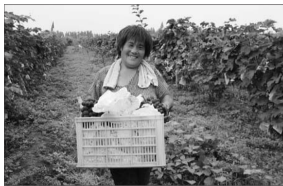
许女士在庆云镇计生政策的扶持下收获了健康与劳动果实。