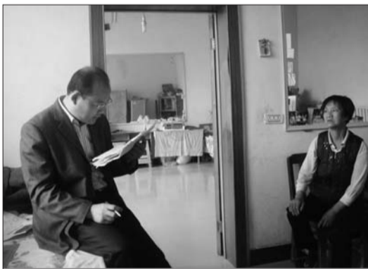
庆云镇包村干部深入计生超生困难户了解情况。