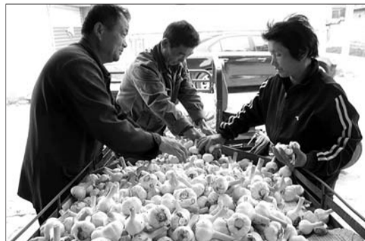
菜农正在忙碌。

本报5月29日讯(见习记者 张文娟) 鲜蒜收购价格每斤8毛钱,为三年来最低价,28日,蔡家镇村村民反映,鲜蒜价格比往年跌了近一倍。