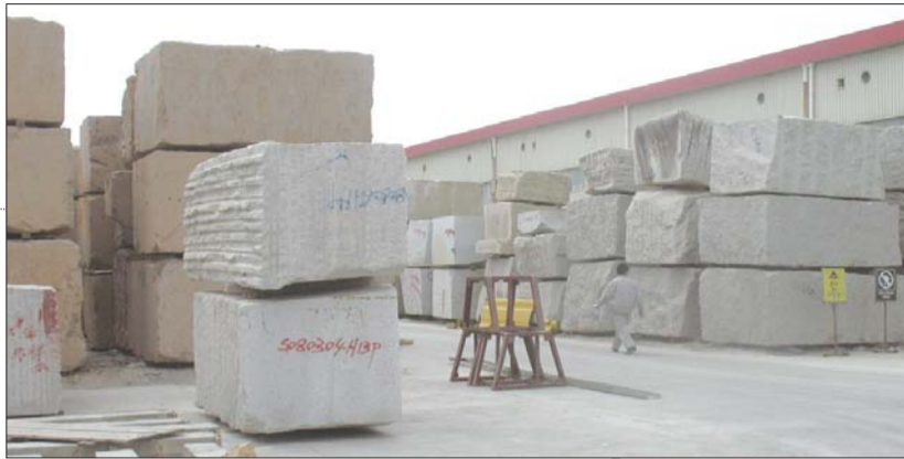
▲进口石料堆放在玉龙石材厂院内。

该会展中心自2003年开始举办首届中国(莱州)国际石材展览会,此后每年一届,展位超过1600个,成交额累计突破400亿元,莱州也成为中国北方最具竞争力的石材集散地。