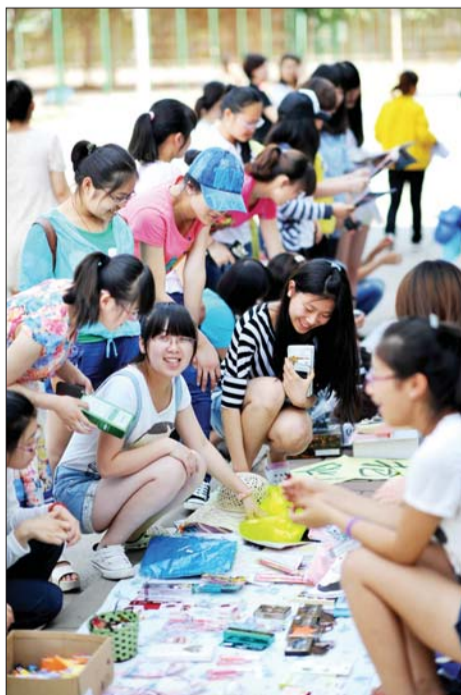
闲置物品交易现场热闹非凡。