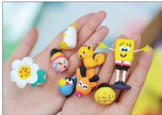
学生们自己捏制的软陶工艺品憨态可掬。