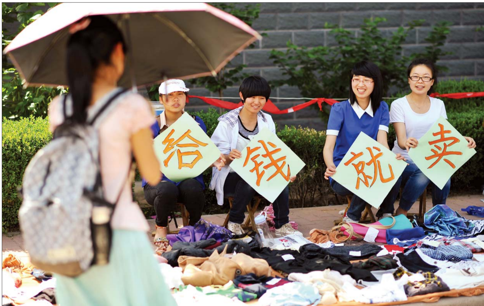
几名女生打出了“给钱就卖”的广告语。