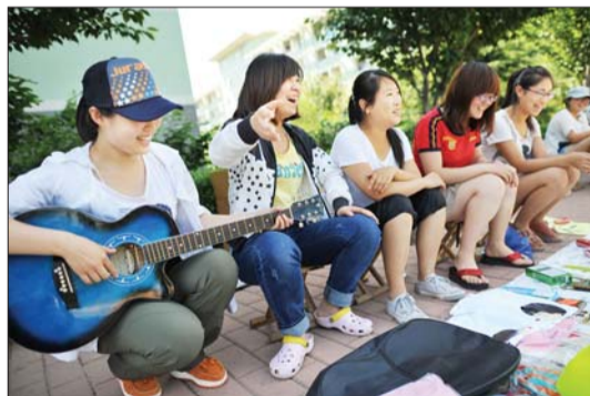
一名卖吉他的女生现场演奏,以吸引买主。