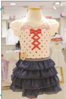
◀Paw in Paw

男童T恤:原价158元 折后110元 成份:主料100%棉 配色100%棉 连衣裙:原价358元 折后251元 成份:主料100%棉 配色100%棉