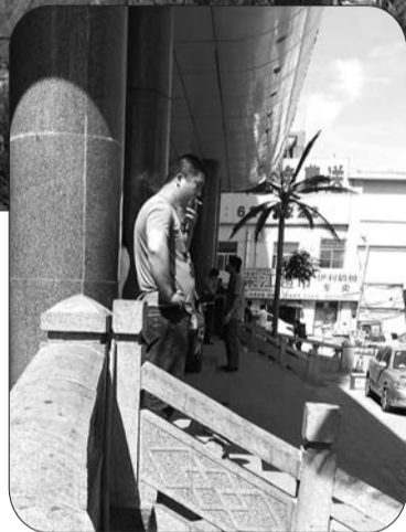
▶一男子手里叼着烟在医院门口吸烟。