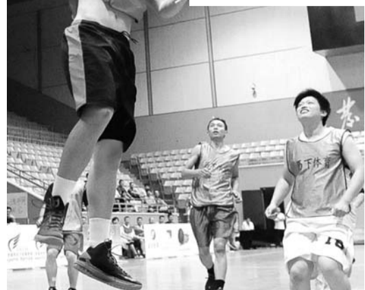
篮球达人挺有巨星范儿。

揭幕战在兄弟连和兄弟联盟之间上演，两支队伍表面上只差一字，实力却相去甚远。由医生组队，长期活跃在省户外篮球场的兄弟联盟，属于纯草根球队，同半专业的兄弟连相比，几乎完全占不到便宜，比分从一开始便陷入落后，最终他们以39:90败下阵来。稍后进行的梦之翼同山东航空之间的较量，实力相对接近，双方比赛的技术含量与火药味也提升了一个档次，最终运动能力更强、体能更充沛的梦之翼队，通过强劲的后程，以及神准的三分，87:37轻松胜出。