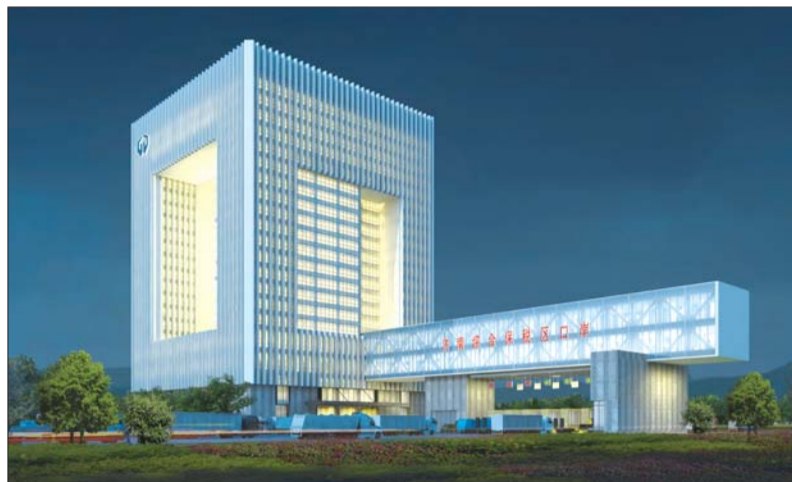
济南综保区新卡口效果图。

本报6月2日讯(记者 修从涛) 2012年5月15日,济南综合保税区经国务院批准设立,这也是全国第21个综合保税区。5月31日,由山东省政府和济南海关组成的联合预验收小组,对济南综合保税区进行了预验收,六月中下旬将接受国家部委正式验收。济南综保区相关负责人介绍,综保区建成后,市民可在家门口买到洋货。