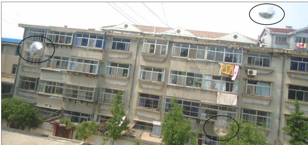
▲一户居民家的玻璃上被打出3个扣子大小的裂痕。

孙先生告诉记者,4个月以来,7户人家“中招”30余次,只他自己就已经报警4次,可案件一直未侦破。“感觉自己时刻都面临生命危险。”孙先生说。