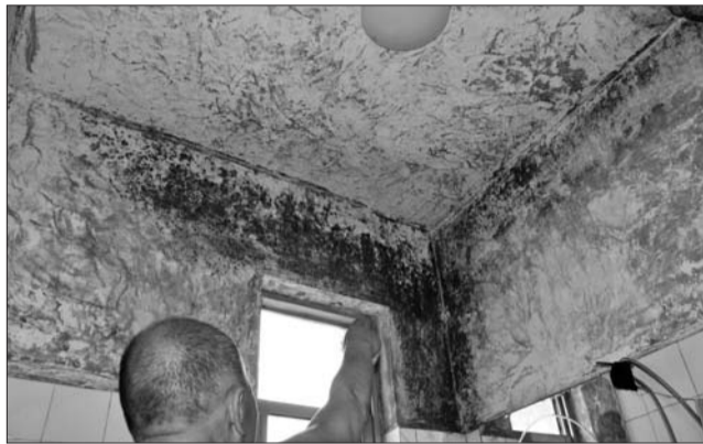
▲韩先生家的屋顶墙皮都已脱落。

“虽然楼顶是公共部分,但其他的住户家房子不漏,想要他们交费很困难。”韩先生无奈地说。