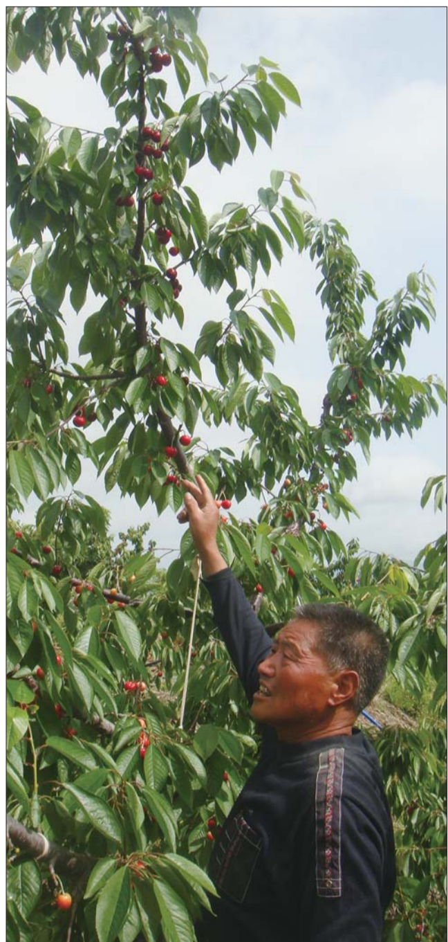
樱桃园里,樱桃已经成熟,就等游客来采摘。

或者安排专门的工作人员讲解提示,当然最重要的还是游客自身要提高素质,在采摘游玩的同时爱惜果实、果树。”对于大规模采摘经营中遇见的问题,回里镇政府宣传办公室副主任倪璐说,他们也正在帮果农想办法。