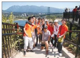
往届夏令营学生在温哥华户外。