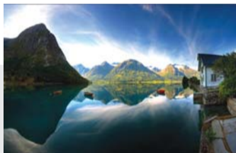
艺术之宫——芦笛岩(宿桂林)。

第四天:餐后乘车返回桂林,途中游金银子王李庄园,欣赏巴沙苗寨短裙苗的原生态歌舞,了解苗族民族文化;参观侗寨古寨观光村。中餐后游览桂林城徽——象鼻山(约60分钟);后游览大自然