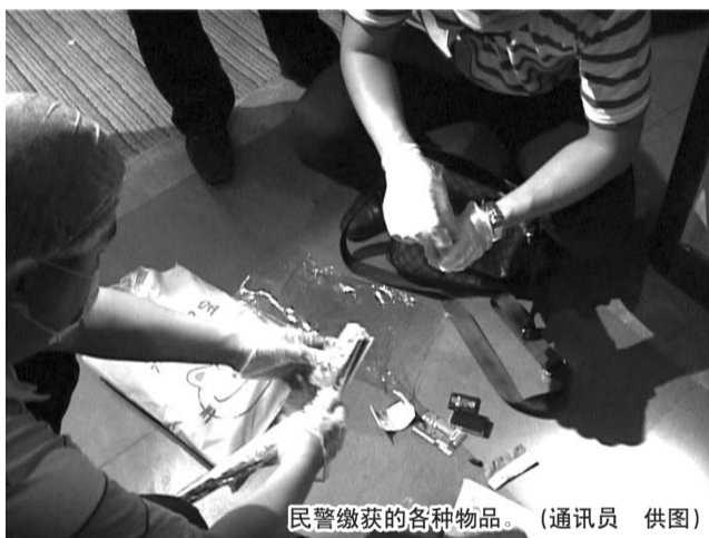
民警缴获的各种物品。