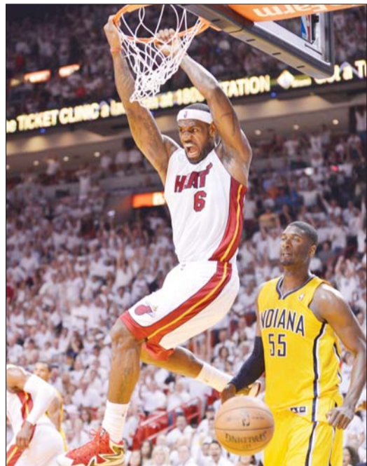
詹姆斯在比赛中扣篮。

对于迈阿密热火而言，在冲冠的道路上遇到步行者这样强劲的对手，把他们最强战力逼了出来，在第七战才展现出卫冕冠军应有的统治力和决胜力。在总决赛来临之际，经历一些磨难未尝不是一件好事。韦德和波什的表现依然将会决定总决赛的走向，詹姆斯迎来自己的最好机会。6年前总决赛失利的场景历历在目，当年邓肯对詹姆斯说，“未来是属于你的。”如今是詹姆斯要对邓肯作出回答的时候了。