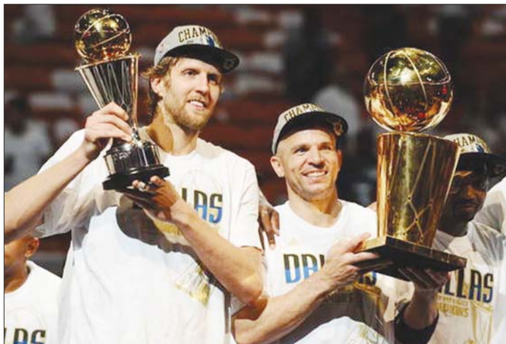
2011年，基德(右)在小牛队捧起总冠军奖杯。

2011年，小牛在总决赛中打败詹姆斯的热火获得总冠军，已经38岁的基德终于登上了NBA的最巅峰。原本基德可以带着伟大的成就就此飘然而去，但他不愿向岁月低头，毅然穿上了尼克斯的球衣再战江湖。或许有人会说，基德作出了错误的选择，但这是对他永不老去的精神最好的诠释。年过不惑的基德再也不能像以前轻易刷出三双，作为近20年来联盟顶级控卫的代表，基德注定在历史最佳控卫上有自己的一席之地。希尔走后，基德也不再留恋球场，NBA那段传奇往事，正在慢慢消散。当联盟最伟大的控卫离开时，他的“老妖精神”已经深深扎根在球迷心中。