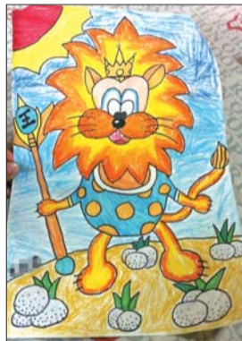
▲小可画的狮子栩栩如生。