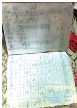
▲在同学家玩了几天后,小可回家琢磨着画出了键盘错乱的电脑。