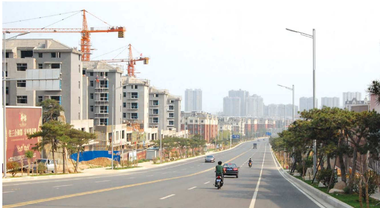
旅游大项目建设、三日游开发吸引更多游客来泰安。(资料片)