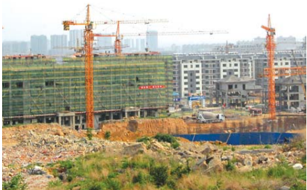
新片区建设如火如荼。(资料片)

另一个反映城市变迁的要素是城镇化水平,今年4月,泰安市规划局网站公布了岱岳区山口镇城市总体规划(2012—2020),这个“一心、两轴、四区”的规划将57平方公里的山口镇规划为泰安市东部重要的工业主导型城镇。到2020年,山镇的城镇化水平将达到79.1%。“山镇的规划拉开了泰安在镇域规划的序幕,为未来邱家店、夏张等乡镇总体规划修编,为循序渐进的推进城镇化建设奠定了基础。”规划局工作人员介绍,这几年,泰安的乡镇开始完