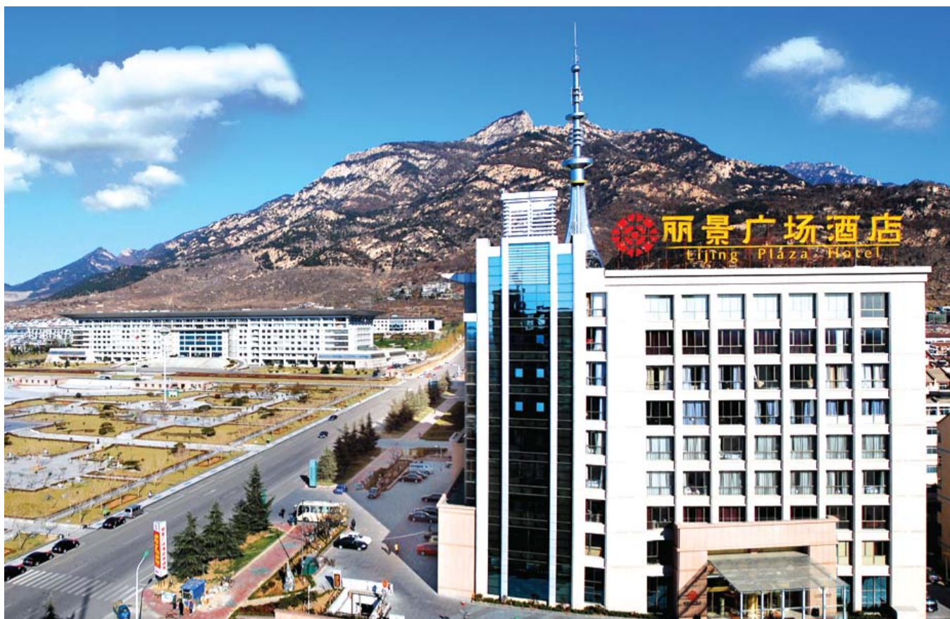
门槛降低后,越来越多的市民走进星级酒店。(资料片)