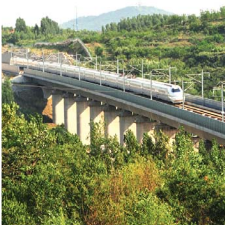
高铁驶出泰安。(资料片)

104国道绕城西线改建后,能节约多少时间?据计算,如果以时速80公里/时,行驶完这28公里的新线路,只需20分钟左右;如果沿目前104国道行驶,从界首桥至迎宾大道,再经长城路,到达满庄镇西河村东北约32公里,以时速80公里/时计算,且不计红绿灯和交通堵塞时间,至少要24分钟。