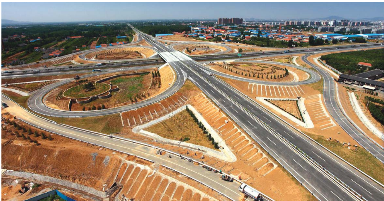
冯家庄互通立交桥正式通车。(资料片)