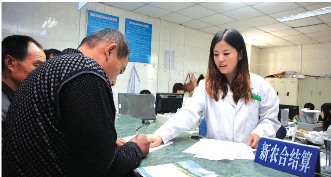
新农合筹资标准逐年提升,老百姓得到了真正的实惠。

改建扩建病房楼,医院规模扩大;新农合筹资标准每年都在增加,报销封顶线逐年提高;基本药物制度覆盖范围扩大,群众在基层就医的负担减轻……5年来,泰安市公共卫生事业发展取得不小的进步。“看医难、看病贵”的问题,得到有效缓解。