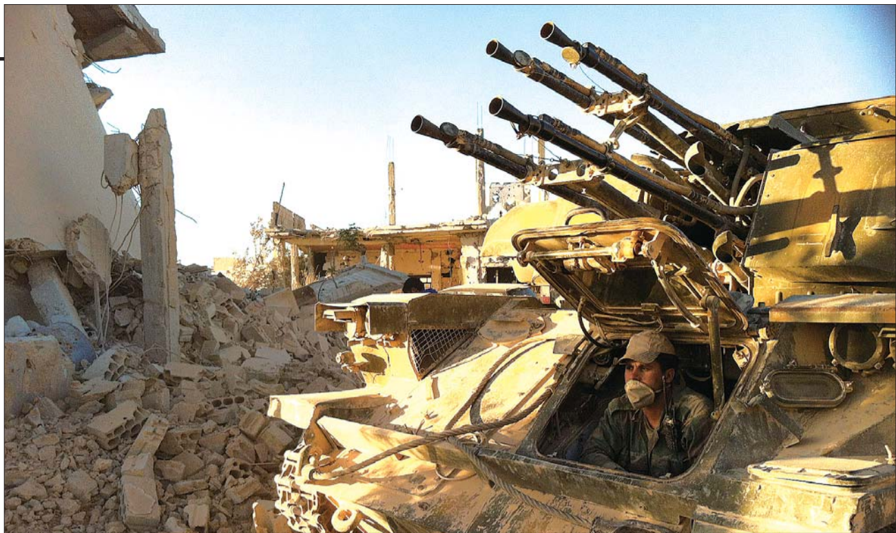
6月4日,在叙利亚西南部的古赛尔镇,一名叙利亚士兵从坦克内向外看。

与此同时,多名美国官员4日披露,美方上月派遣外交代表团,前往俄罗斯展示叙利亚政府军使用化武的证据,然而未获俄方采信。