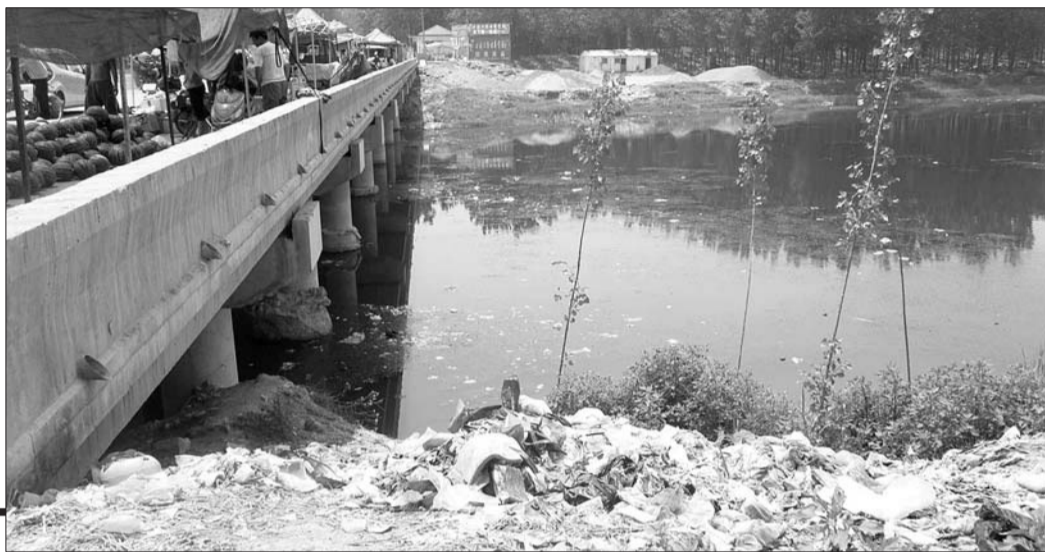
◀万福河下庙桥下已被垃圾“占领”。

近日, 许多市民拨打本报6330000热线电话反映, 万福河几乎成了“垃圾站”, 严重的地段垃圾遍地都是。连日来, 记者顺着南外环从万福河下庙桥段一直走访到马张庄段, 发现垃圾分布呈现规律性——只要有居民区, 对应河岸基本上会有大片的垃圾。采访中记者了解到, 没有固定的垃圾投放点是沿岸居民选择向万福河倾倒垃圾的主要原因。