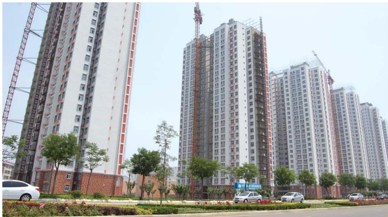
京沪高铁A片区保障房,一直没有取名。