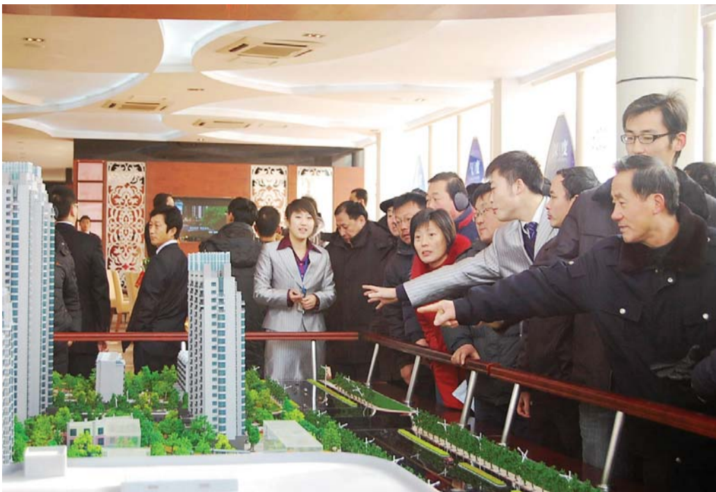
志高国际开盘,大批市民来看。

12万平米SHOPPING MALL、五星国际会所,国际双语幼儿园,新颖的小复式户型……2008年,志高集团进驻泰安。2009年开发的志高国际项目为核心城区少数大盘之一,为泰城带来先进的开发理念和营销模式。这个近2000套房源的大型社区,同样也成为泰城东部的核心地标之一。