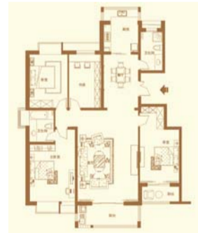
2-D 四室两厅两卫 面积约187.62㎡

全明府邸:类多层式全明方正户型,南北通透,自然穿堂,贵气天然; 尊贵厅堂:4.35M开间阔景客厅,与超大景观阳台一脉相承,草木为伴,颐养心性; 餐客通透:餐厅客厅自然通风,私密餐厅与厨房亲密相拥,独立餐厨区域,曼妙用餐时光; 奢华主卧:独立采光卫浴间,奢享尊贵室内日光浴;豪华阳台引入入室,延伸空间尺度。