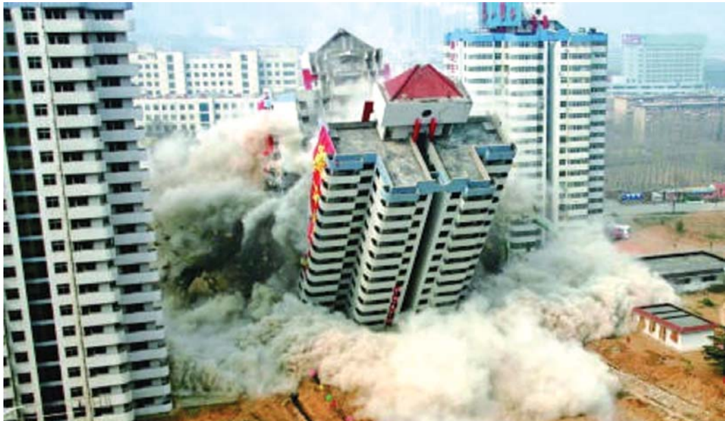
长城小区爆破。(资料片)

2010年,长城小区9号楼爆破拆除,拉开了长城路北段综合开发的序幕,如今,从圣地公寓到泰山公馆,总共不到2公里远的道路两侧,一改2008年之前的荒凉,变成泰安最富现代气息的高档商务区。