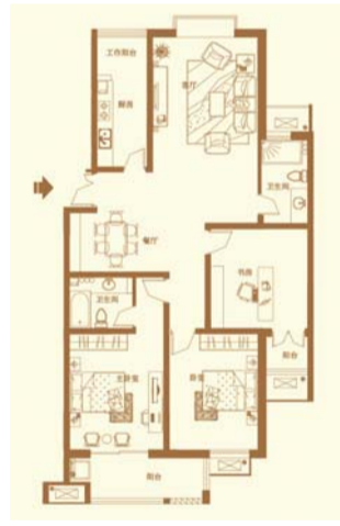
3-A 三室两厅两卫 面积约159.06㎡

高性价比:户型方正,建筑礼让空间,高得房率,实用居家; 阳光厅堂:南向客厅平稳而阔绰,与绿藤花香缭绕的步入式阳台为舞,生活在阳光中; 功能厨房:L型餐厨,流线功能主义,演绎锅碗瓢盆协奏曲; 情景露台:主卧与露台相连,延展一方独立天地,草藤花香,月光美酒,景致上映。