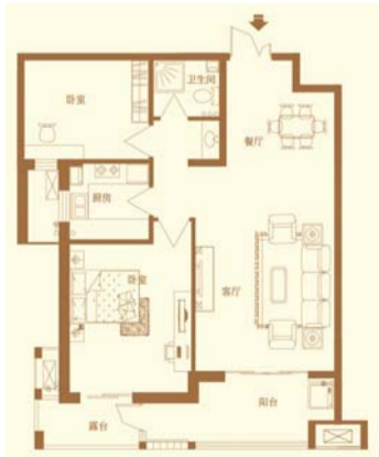
2-B3 两室两厅一卫 面积约103.02㎡