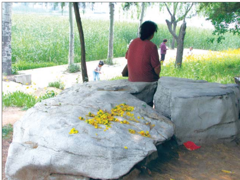
红石公园提倡爱护花草，但仍有花朵被摘下

6月5日是“世界环境日”，然而记者在红石公园却发现，贴小广告、乱丢垃圾等不文明行为屡屡出现，公园管理方在提醒市民注意保持卫生时，有时还会遭到市民的误解。公园是市民休闲健身的最佳场所，也是展示城市文明构建的一面窗口，让我们来共同维护这面城市的“窗口”。