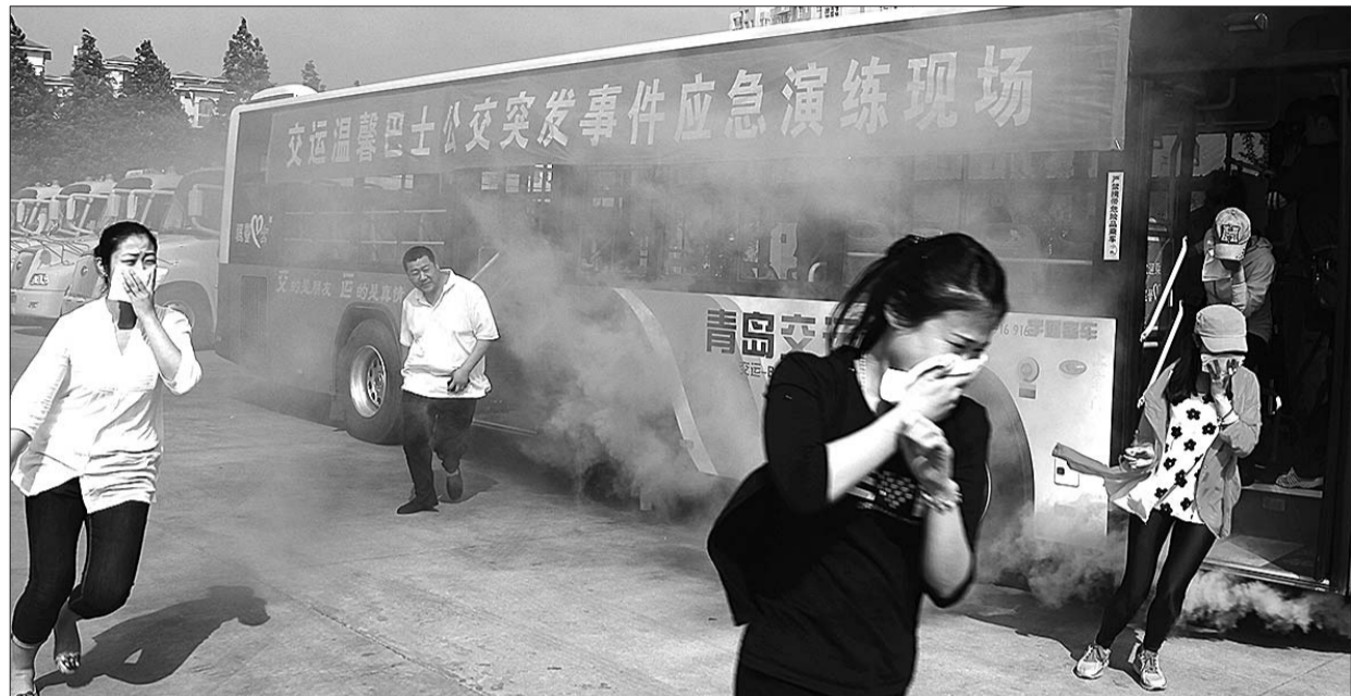
8日,青岛一公交公司进行消防逃生演练。

本报潍坊6月8日讯(记者 赵松刚) 8日,记者探访1路、2路、6路、12路等48辆公交车,发现车上配备的安全锤没有一把丢失。据公司介绍,现在很少有公交车安全锤被拿走的情况。