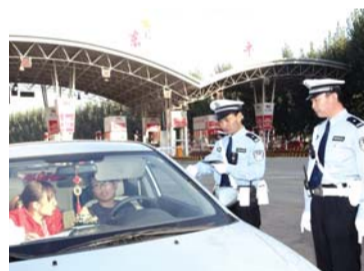
严查超速确保行车安全。