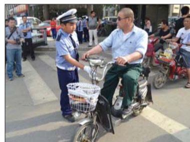
小交警劝导电动车主回到停车线后。

不仅是送鲜花,为了缓解东岳大街青年路口的交通压力,合理分流机动车与非机动车,民警在该路口设置非机动车等待区,使机动车停车线后移,空出来的区域供非机动车等信号灯时使用,大大减轻了道路交通压力。