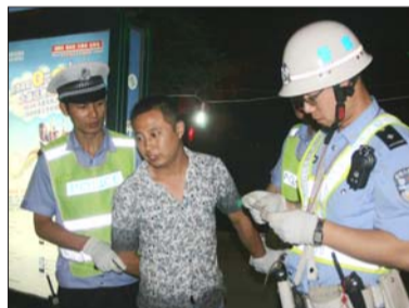
集中整治酒驾交通违法行为。