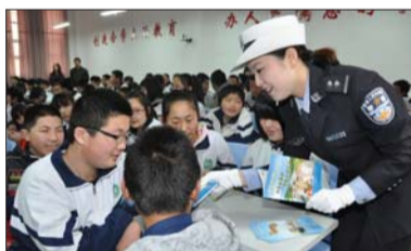
定期为中小学生普及交通安全常识。