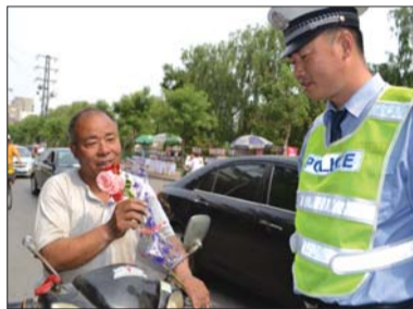
交警向自觉遵守交通法规的市民送花。