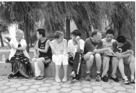
▲学生与外教在一起