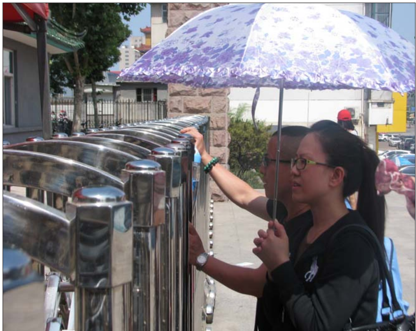
莱芜十七中门口，陪考的家长并不多