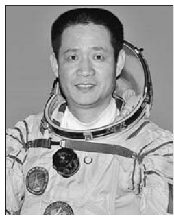
聂海胜,男,汉族,湖北省襄阳市人。中共党员,硕士学位。

1964年9月出生,1983年6月入伍,1986年12月入党。现为中国人民解放军航天员大队特级航天员、少将军衔。安全飞行1450小时,被评为空军一级飞行员。