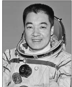
张晓光,男,满族,辽宁省锦州市人,中共党员,硕士学位。

1998年1月,正式成为我国首批航天员。经过多年的航天员训练,完成了基础理论、航天环境适应性、专业技术等八大类几十个科目的训练任务。2005年10月,执行神舟六号载人飞行任务,获得圆满成功。2013年4月,入选天宫一号与神舟十号载人飞行任务飞行乘组。