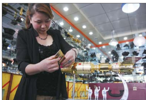
酒泉一家工艺品店的工作人员演示神舟十号与天宫一号模型的对接操作。

贾竟云说,从“神一”到“神十”,他卖过所有的纪念品,几乎没有缺席过。每年的6-10月份,是航天游的最佳时间,每到此时就