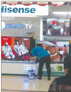
11日,在苏宁电器青年路店,各大电视专柜都在播放神十飞天。

有意思的是,记者走访了市中心各大商场发现,前来购物的的人还不如销售人员多。“端午节活动倒是不少,优惠也挺大,可能今天下午大伙都在看神十发射吧,客户少了。”一位销售人员猜测。