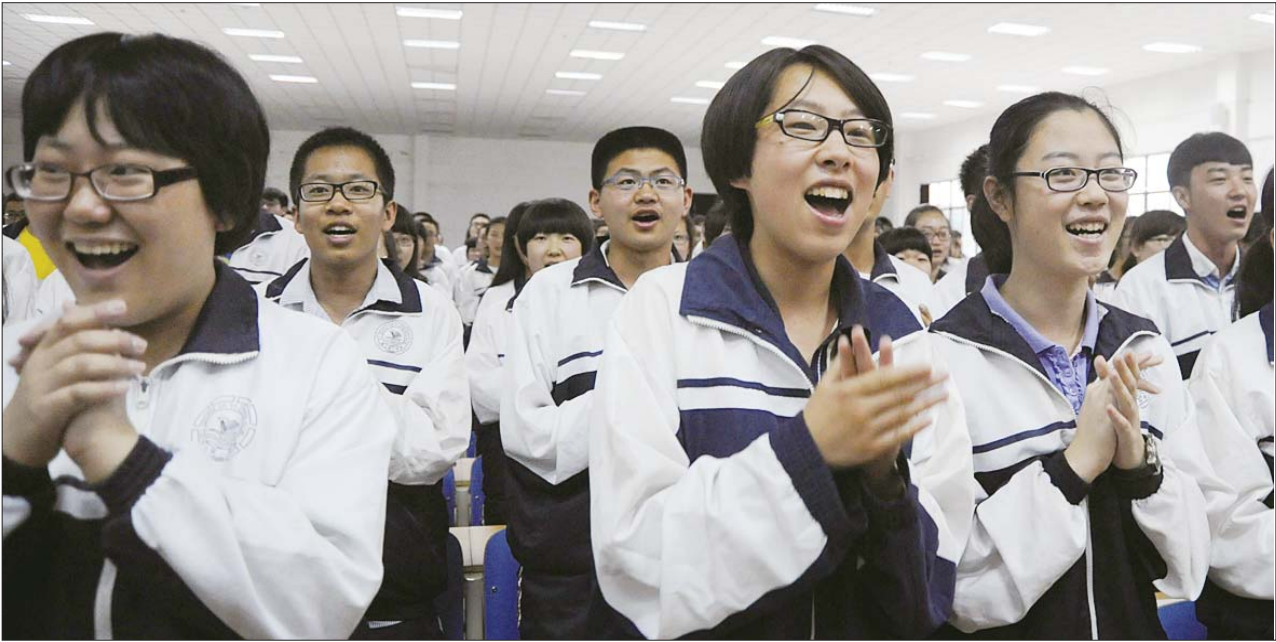
神十发射成功,福山一中的学生兴奋地呐喊、鼓掌。