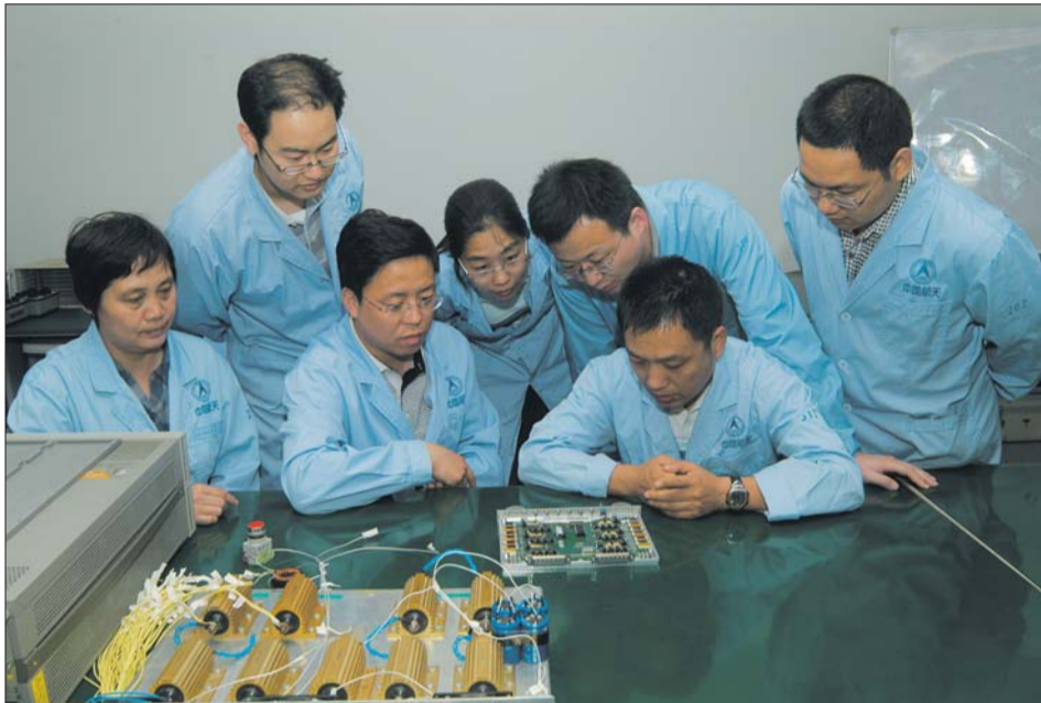
513所失重生理装置Ⅱ研制团队正在研究课题。

在设备研制时,不仅要考虑设备的可靠性和兼容性,还要考虑人机功效学、便于航天员操作,并考虑设备对航天服和航