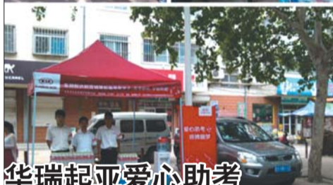
华瑞起亚爱心助考

6月7日至6月9日,潍坊华瑞起亚店安排工作人员在高考考点学校附近设置爱心助考点,为广大考生及高考现场的工作人员等免费提供解暑矿泉水,让考生在高考这个特殊的时刻感受到些许清凉。潍坊华瑞起亚店愿意和蓝天的广大考生及家长一起分享成功的欢笑与喜悦,衷心祝愿广大考生金榜题名。