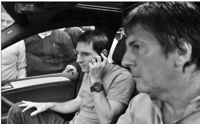
梅西和他的父亲。(资料片)